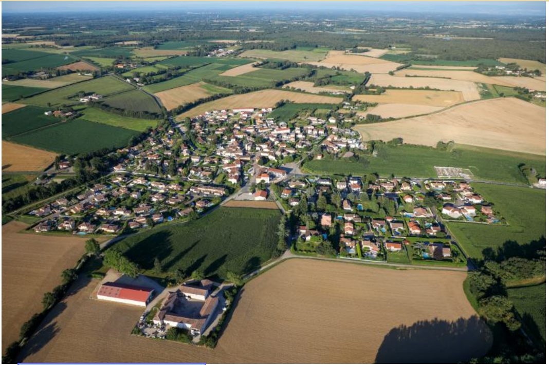
Le village vu côté ouest