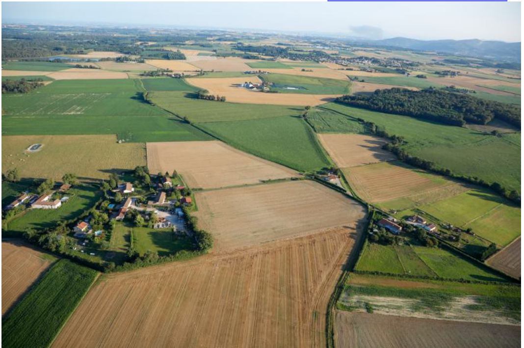
L'Herbage et La Briette